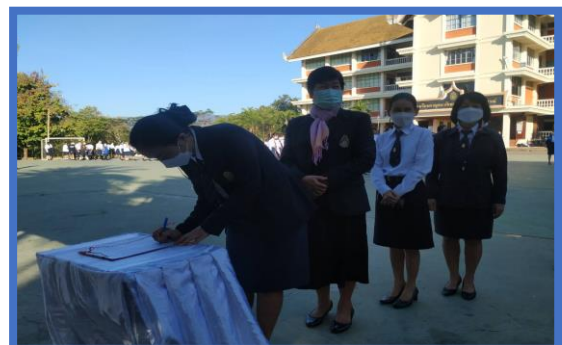
วันศุกร์ ชุดประจำโรงเรียน