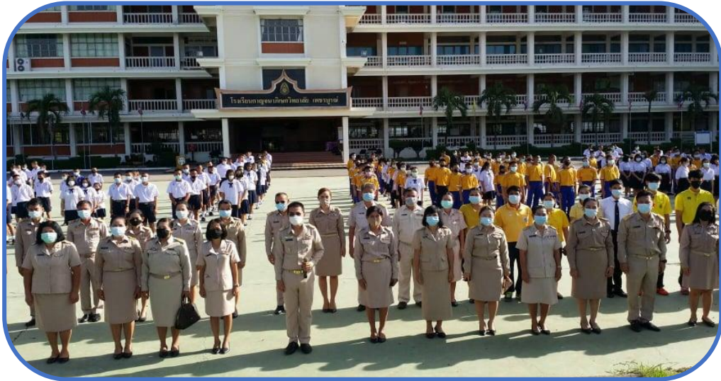
วันจันทร์ ชุดข้าราชการสี kaki