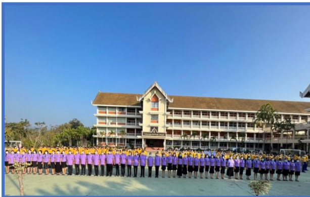
วันอังคาร