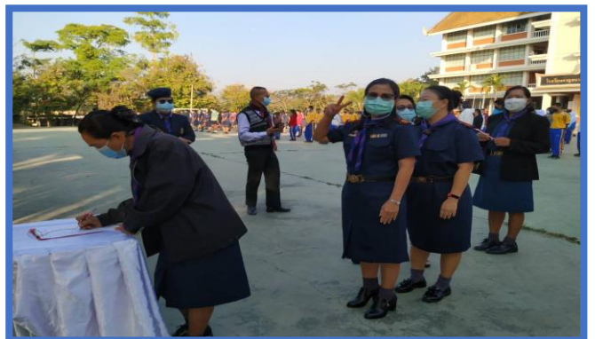
วันพุธ ครู ม.ต้นแต่งชุดลูกเสือ